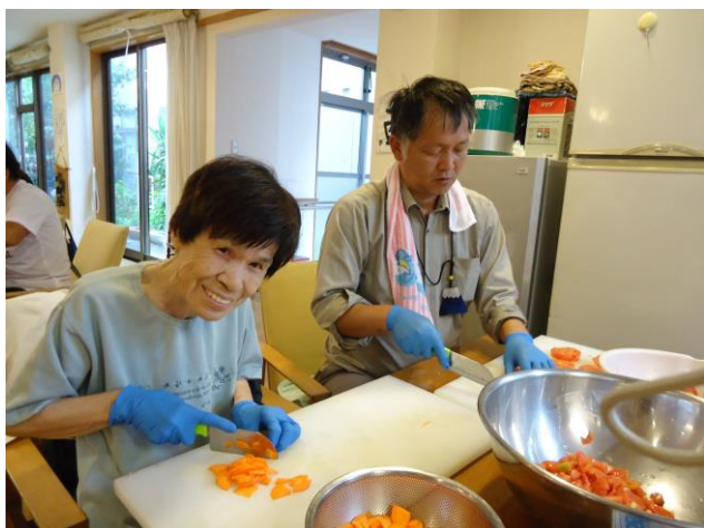
①誰かと一緒に挑戦できる