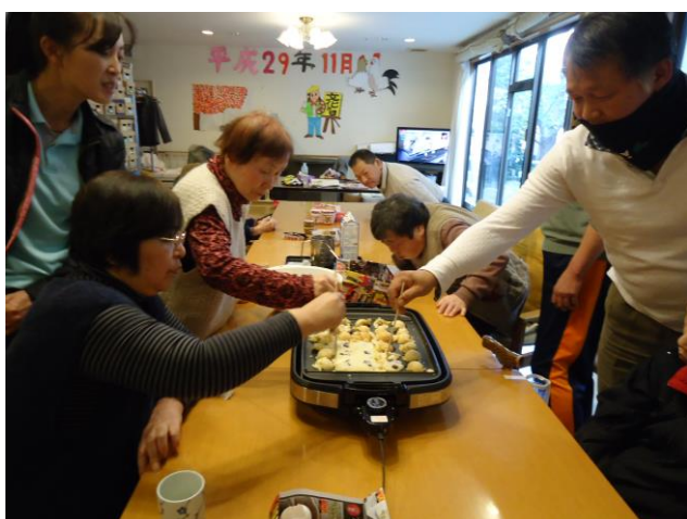
③一緒に楽しくおいしく