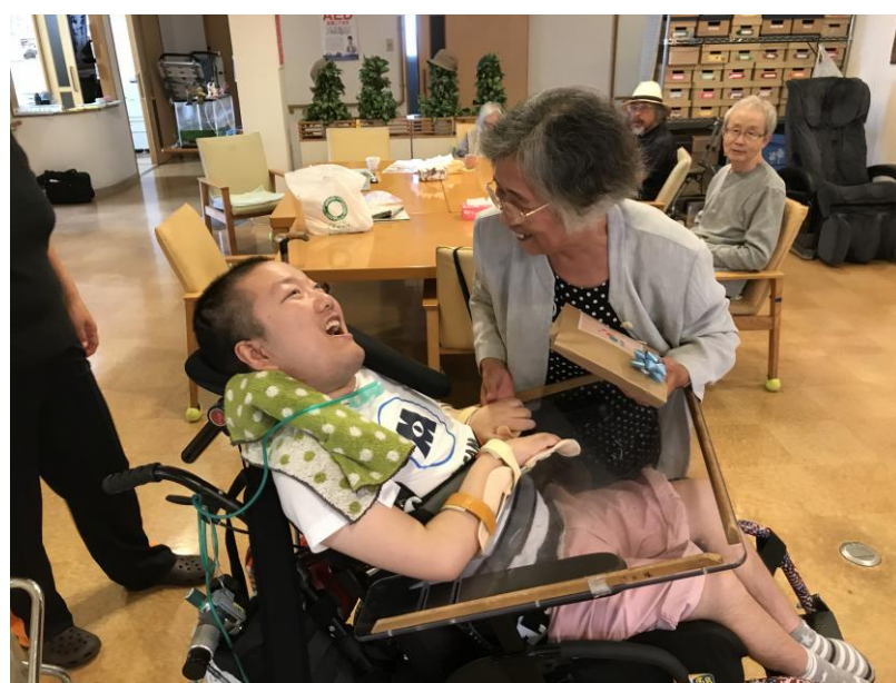
②いつも声かけて。互いに気配り