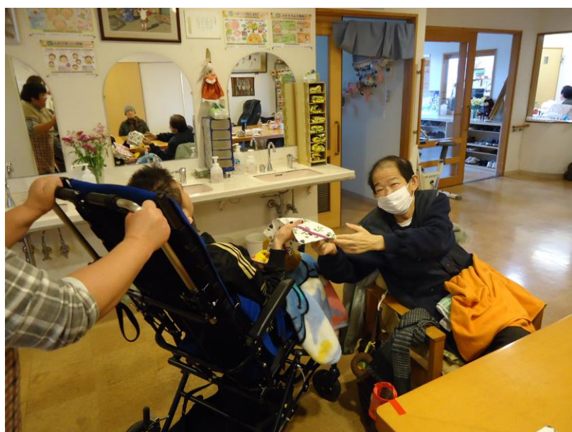
①それぞれ役割を持って