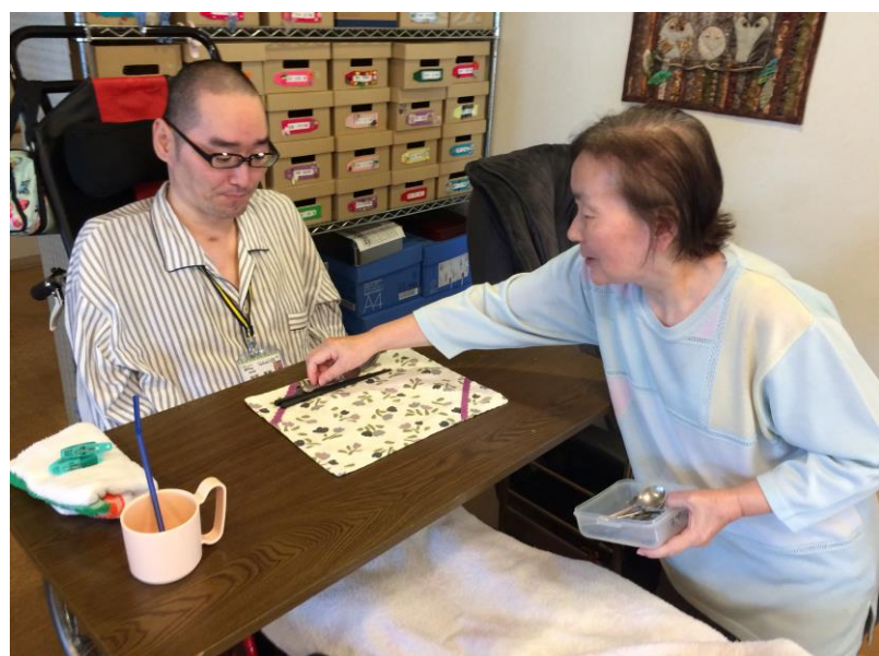
③食事の準備中にお礼の一言が