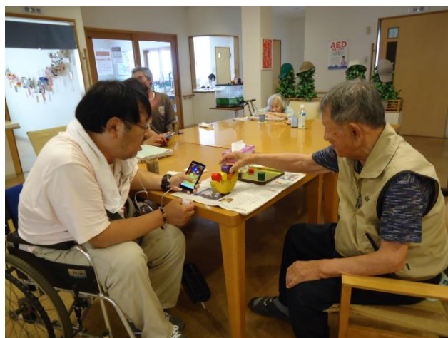
②得意なことは互いにアドバイス