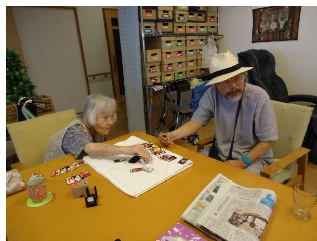
④頭を使い、自然にリハビリ

①手がうまく使えず、包丁を持ったことがなくてもだれかとなら教わりつつ楽しく料理に挑戦。